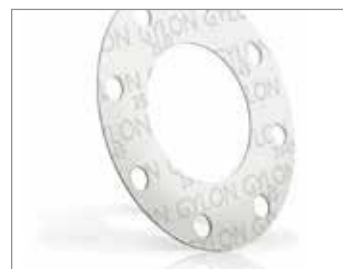
GYLON® SOFT STYLE 3545

Ściśliwe warstwy dostosowują się do chropowatej powierzchni, szczególnie na kołnierzach wypaczonych, porysowanych lub z ubytkami. Sztywny rdzeń wykonany z PTFE ogranicza pęcznienie na zimno zazwyczaj kojarzone ze zwykłymi uszczelkami z PTFE.