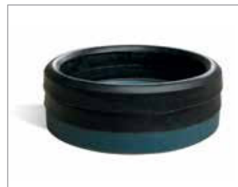
BLUE DURATUFF® WELL SERVICE PACKING

Blue DURATUFF® został zaprojektowany by zapewnić maksymalną zdolność do uszczelniania pomp studziennych. Opatentowany materiał został wykonany tak, aby wyeliminować wciskanie do szczeliny i zapewnić doskonałą odporność na ścieranie w pompach szczelinujących, zakwaszających i cementujących.