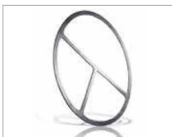
USZCZELKI WYMIENNIKÓW CIEPŁA

Dopasowane konfiguracje dostępne w szerokiej gamie materiałów i typów. Rozwiązanie dla niemal każdego zastosowania.