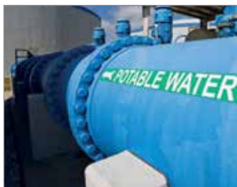
WODA I ŚCIEKI

Czysta woda, niegdyś jeden z wielu produktów, obecnie uznawana jest za jeden z najcenniejszych zasobów ziemi. Firmy grupy Garlock oferują rozwiązania, które pomagają sprostać zaostrożonym wymaganiom, a także zapotrzebowaniu różnych procesów.