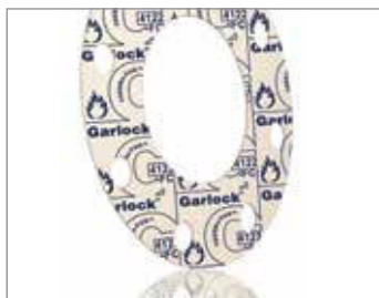
THERMa-PUR™ STYLE 4122

Ten wyjątkowy materiał uszczelniający został zaprojektowany do użytku w wysokich temperaturach i może wytrzymać ciągłą lub cyklicznie zmienną temperaturę do 1 832°F (1 000 °C). Jego opatentowana formuła jest odporna na utlenianie, stanowi izolację elektryczną i jest odporna na wchłanianie wody i innych płynów.