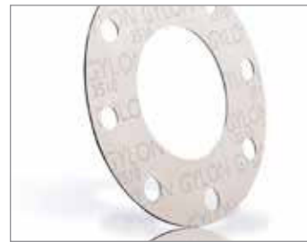
GYLON® WHITE STYLE 3510

Produkt o najszerszej odporności chemicznej. Polecany dla wysoko agresywnych substancji, w tym kwasu fluorowodorowego, fluorków aluminium, chlor/alkalia, roztworów wodorotlenku potasu i kąpeli galwanizacyjnych. Spowalnia polimeryzację monomerów.