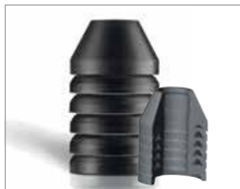
LUBRIKUP® FLUID-SEAL™ CONE PACKING

Sensacyjna wytrzymałość szczeliwa prętu Fluid-Seal w stożkowej dławicy. Uszczelnienie typu wargowego i przestrzenie pomiędzy pierścieniami stanowią idealne płynne niewiążące uszczelnienie.