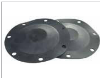
WYTRZYMAŁE MEMBRANY GUMOWE

Oferowane w szerokiej gamie wytrzymałych rodzajów gumy. Mamy również możliwość doboru składników, które spełnią szczególne wymagania klienta.