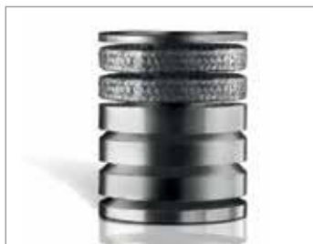
STYLE 8093 DSA

Innowacyjny zestaw sznurów do pomp, zaprojektowany do pracy w suchych warunkach i przy zmniejszonym zużyciu wody.