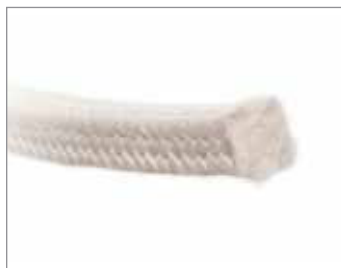
STYLE 5888, 5889, 5898, 5904

Gęste, nieporowate, ciągłe włókno PTFE jest odporne na działanie chemikaliów i zapobiega wyciekom przez splot. Idealne dla zaworów i pomp w przemyśle chemicznym, spożywczym i przetwórczym.