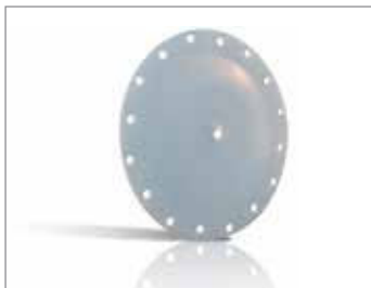
GYLON® STYLE 3522

Produkt ten, produkowany wyłącznie przez firmę Garlock, o udowodnionej skuteczności jest wytwarzany w opatentowanym procesie, który umożliwia optymalizację jakości i jednorodności. Dzięki najlepszej dostępnej technologii membrany GYLON® PTFE zapewniają większą trwałość w przemyśle i ciągle przewyższają konkurencyjne materiały.