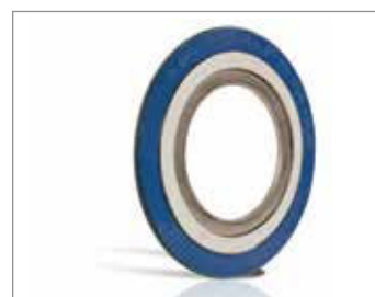
THERMa-PUR™ SPIRALNIE ZWIJANY

Do istniejącej linii produktów THERMa-PUR™- dodajemy wersję spiralnie zwijaną. Uszczelka THERMa-PUR™ spiralnie zwijana, została zaprojektowana z myślą o ekstremalnych temperaturach oraz agresywnym chemicznym środowisku.