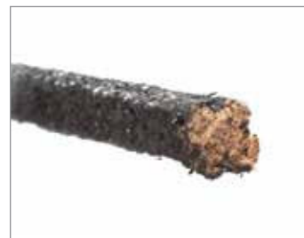
STYLE 1925, 8921-K, 8922

Impregnowany olejem sznur z plecionych włókien syntetycznych sprawdza się znakomicie przy minimalnym zużyciu wałka i tulei. Doskonali do zastosowań ogólnych.