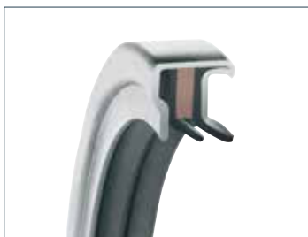
PS-SEAL® NON-STANDARD, TANDEM