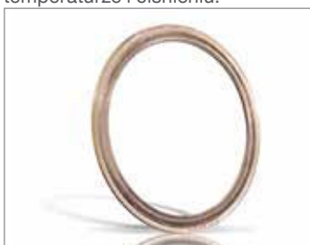
FLEXSEAL® Spiralnie zwijany

Wykonana poprzez zwijanie naprzemienne taśmy metalowej i miękkiego materiału wypełniającego takiego jak elastyczny grafit lub PTFE. Idealny do standardowych kołnierzy, wymienników ciepła, włączów i innych zastosowań w wysokiej temperaturze i ciśnieniu.