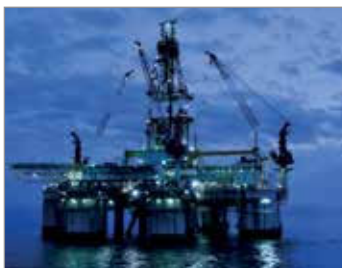
ROPA NAFTOWA I GAZ

Programy firmy Garlock dla przemysłu ropy naftowej i gazu zawierają rozwiązania, dotyczące konserwacji na miejscu, zapewniają wykonawstwo systemów monitorowania emisji i programy napraw, umożliwiają raportowanie zintegrowanej kontroli zapobiegania zanieczyszczeniom, gwarantują kompleksowe uszczelnianie w zakładzie, specjalne projekty i niską emisję.