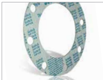
STYLE IFG 5500

Uszczelnienia typu IFG, oparte na bazie włókien nieorganicznych, charakteryzują się doskonałą stabilnością termiczną oraz zapewniają mniejszy spadek naciągu śrub. Temperatura pracy ciągłej: 290°C.