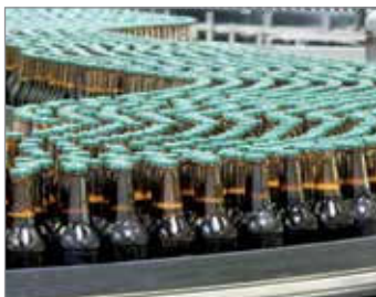
PRZEMYSŁ SPOŻYWCZY PIWOWARSKI I ROZLEWNICZY

Produkujemy uszczelnienia mając przede wszystkim na uwadze szczególne potrzeby rynków spożywczych.