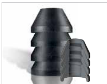
LUBRIKUP® CONE PACKING

Uszczelnienie stożkowe LUBRIKUP® to jakość i doświadczenie, które zaspokajają Państwa wymagania. Cone Packing jest dostępne w szerokiej gamie materiałów. Standardowy, TEFLON® Flake, DURAGOLD™ (płatki mosiądzu) Impregnowany, połączenie DURAGOLD i TEFLON® Flake lub DURATUFF®.