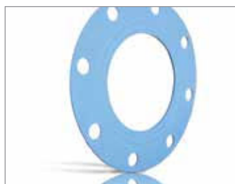
STRESS SAVER® GYLON® STYLE 3504

Uformowanie nieco wystających ponad powierzchnię zeber pomaga uzyskać wzrost szczelności dzięki lokalnej koncentracji nacisku, idealne do lekkich rurociągów.