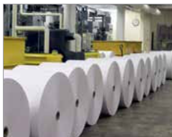
CELULOZA I PAPIER

Skrócenie czasu postojów i zwiększenie efektywności zajmują kluczowe miejsca na liście priorytetów każdego producenta, a w szczególności tych w przemyśle celulozowo-papierniczym. Innymi ważnymi punktami tej listy są obniżenie zużycia wody i zmniejszenie wpływu na środowisko w sposób rentowny. Grupa firm Garlock oferuje rozwiązania dla wszystkich tych wyzwań i wiele innych.