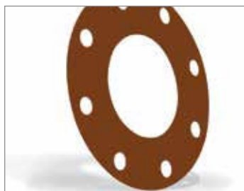
GYLON® STANDARD STYLE 3501-E

Popularne rozwiązanie dla uniwersalnych zastosowań w przemyśle chemicznym i petrochemicznym. Odporność na wysokie ciśnienie i temperaturę (P x T) oraz minimalne pęcznienie na zimno znacznie przewyższa parametry konwencjonalnego PTFE.