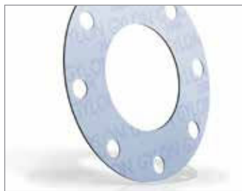
GYLON® BLUE STYLE 3504

Wysoko ściśliwy i elastyczny dzięki dokładnie kontrolowanemu procesowi równomiernego wypełnienia szklanymi mikrokulkami. Doskonali do elementów o niskim naprężeniu, wymagających małego momentu podczas napinania śrub (np. emaliowane i plastikowe kołnierze, rury szklane, sprzęt poliestrowoszklany itd.). GYLON® 3504 to podstawowy materiał, używany do produkcji linii produktów GYLON BIO-LINE®, uszczelki zgodnych z normą EN 1935.